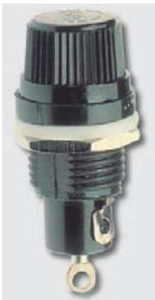
Foto e disegno (dimensioni in mm) / Product image and drawing (dimensions in mm)