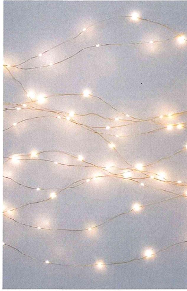
Tenda 220 nano led - L. 3,3 x H. 1 m