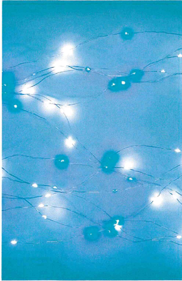
Tenda 220 nano led - L. 3,3 x H. 1 m