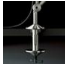
TOLOMEO MORSETTO A004100