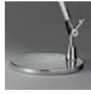
TOLOMEO BASE D 200 ALL A008600