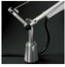
TOLOMEO SUPP.TAVOLO FISSO A004200