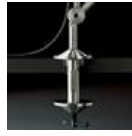
TOLOMEO MORSETTO A004100