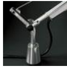
TOLOMEO SUPP.TAVOLO FISSO A004200