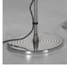
TOLOMEO MICRO SUPPORTO TERRA A043900