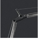
TOLOMEO TERRA SNODO A014000