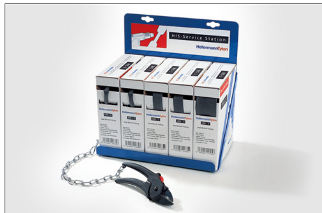
HIS-Service Station comprende 5 dispenser e uno speciale cutter.