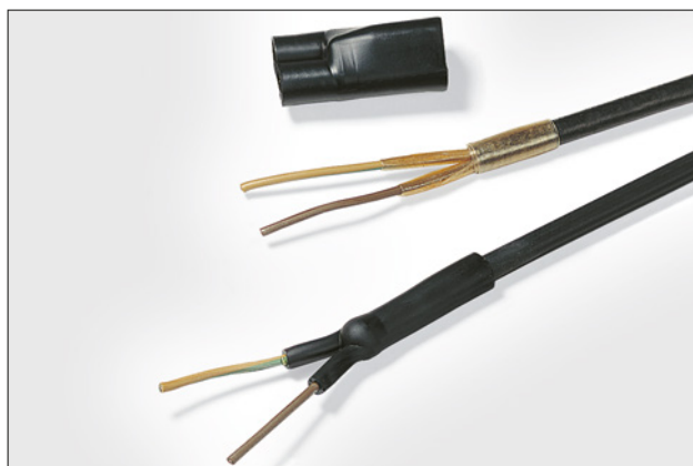
Il nastro termofusibile HMT200A per sigillare contro umidità.