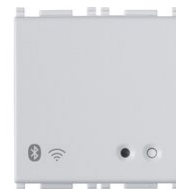
14597.SL - Gateway connesso IoT 2M Silver