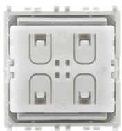
03925 - Comando radio Bluetooth Low Energy 14203.SL - Presa 2P+T 16A P17/11 Silver