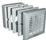
F 120/5" Codice 22132