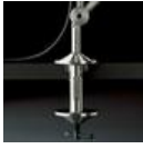
TOLOMEO MORSETTO A004100