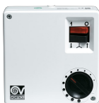
SCNR5 UNIF.X NK SOFFITTO Codice 12955