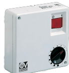
SCNR/M SCAT.COM. NON REV. MULT. Codice 12982