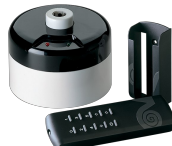
TELENORDIK 5T Codice 22387