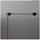
AGGREGATO SOSP ROSONE DECENT A086000