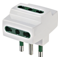
00321.B - Adattatore mult. S17+3P17/11 bianco