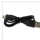
Cavo di alimentazione USB