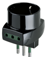
00322 - Adattatore mult. S11+2P11+P30 nero