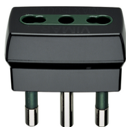
00300 - Adattatore S17 + P17/11 nero