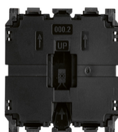
30000.2 - Meccanismo interruttore 1P 10AX 2M