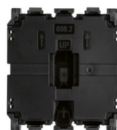
30008.2 - Meccanismo pulsante 1P NO 10A 2M