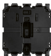
30004.2 - Meccanismo deviatore 1P 10AX 2M