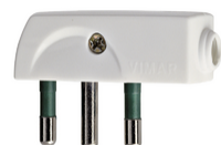
00207.B - Spina 2P+T 16A SPA17 90° bianco