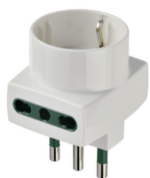
00323.B - Adattatore mult. S17+2P17/11+P30 bianco