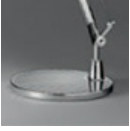
TOLOMEO LETT BASE ALL A014900