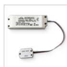
Alimentatore 700mA corrente limitata 34,5-57,5Vdc