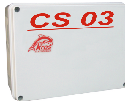
CONTENITORE IP56 DIMENSIONI: 240 x 190 x 90mm

CENTRALE SEMAFORICA CONTROLLATA A MICROPROCESSORE PER LA GESTIONE DI N° 3 SEMAFORI A 2 LUCI (ROSSO /VERDE).