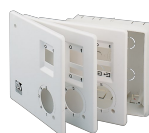
KIT SCB5 (TRASF.5 V.) Codice 22483