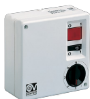
SCNRL5 UNIF. X NK SOFFITTO Codice 12957