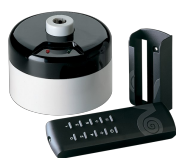
TELENORDIK 5T Codice 22387