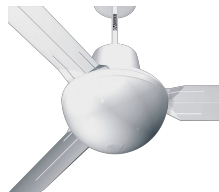
EVOLUTION LIGHT KIT ES Codice 22414