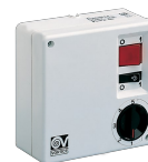
SCR5L Codice 12964