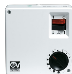
SCR5 Codice 12963