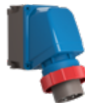
SERIE X-CEE Spine da parete 65° safety performance IP66/IP67/IP68/IP69

Versioni da 63A e 125A disponibili dal 2019