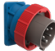
SERIE X-CEE Spine da pannello inclinate 20° safety performance 50-60Hz IP66/IP67/IP68/IP69

Versioni da 63A e 125A disponibili dal 2019