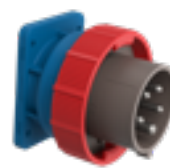
SERIE X-CEE Spine da pannello diritte safety performance 50-60Hz IP66/IP67/IP68/IP69

Versioni da 63A e 125A disponibili dal 2019