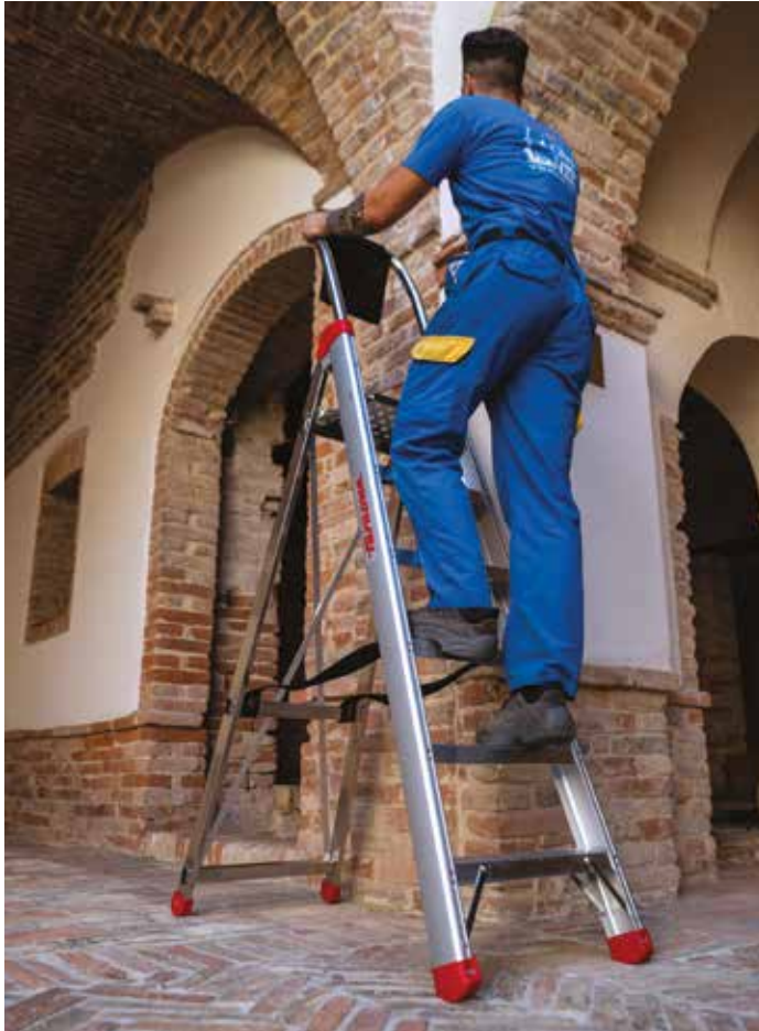
Versatile in ogni situazione garantendo stabilità e sicurezza. Versatile in any situation, it guarantees stability and safety.