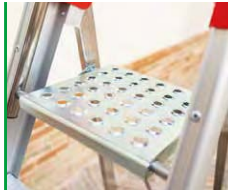
Piano di lavoro professionale antiscivolo e montante ergonomico in alluminio ossidato argento. Professional anti-slip platform and ergonomic upright made of silvery aluminium.