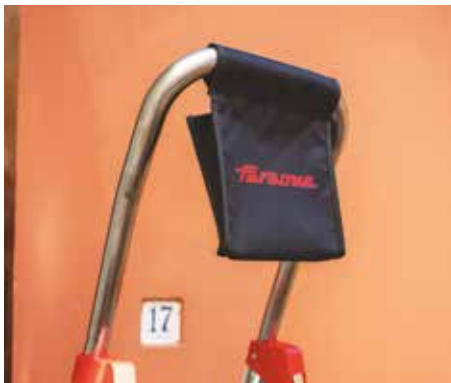
Comoda e robusta sacca portaoggetti. Practical tool bag.