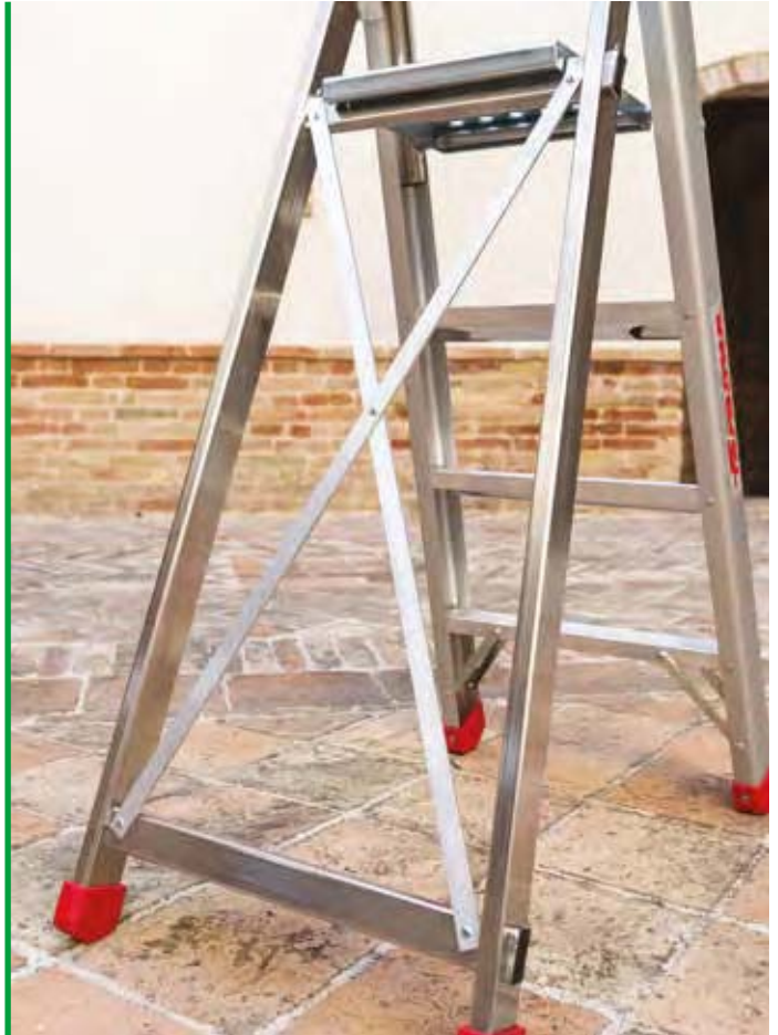
Sistema di stabilizzazione a croce. Cross-stabilising system.