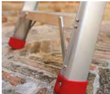
Maggiore stabilità con le traverse di rinforzo agli angoli. Increased stability with reinforced crossbars on the corners.