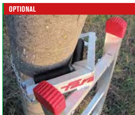
Poggiapalo cod. P8. Pole support cod. P8.