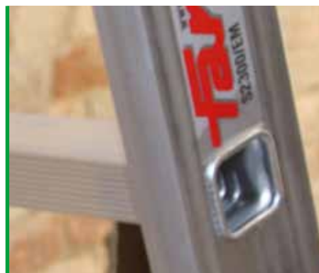
Gradino 30x30 mm. Rung 30x30 mm.

LE IMMAGINI SONO FORNITE AL SOLO SCOPO ILLUSTRATIVO E NON COSTITUISCONO ELEMENTO CONTRATTUALE. THE IMAGES ARE PROVIDED ONLY FOR ILLUSTRATION PURPOSE AND DO NOT CONSTITUTE A CONTRACTUAL ELEMENT