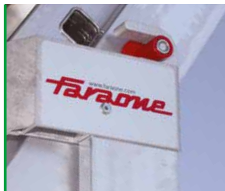
Possibilità di utilizzo come scala zoppa. Can be adjusted to use on stairs.