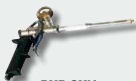
PUR GUN p. 81

CONSIGLI PER GLI ACQUISTI WE ALSO RECOMMEND